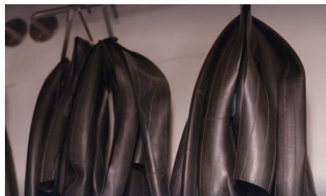
Morceaux de caoutchouc