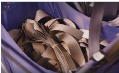
Ceintures de sécurité