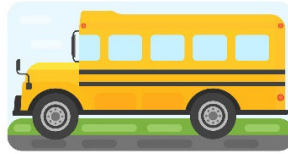
d. autobus scolaire.